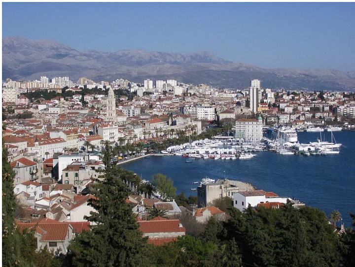
Поглед на Сплит са Марјана

Вечери смо проводили у шетњама до дела Градца, који се зове Водице и где су се већ налазила одмаралишта неких сарајевских предузећа. Тада нисам могао знати да ће овај део Јадрана између Плоча и Макарске постати босанско – херцеговачка ривијера. Није тешко погодити зашто.