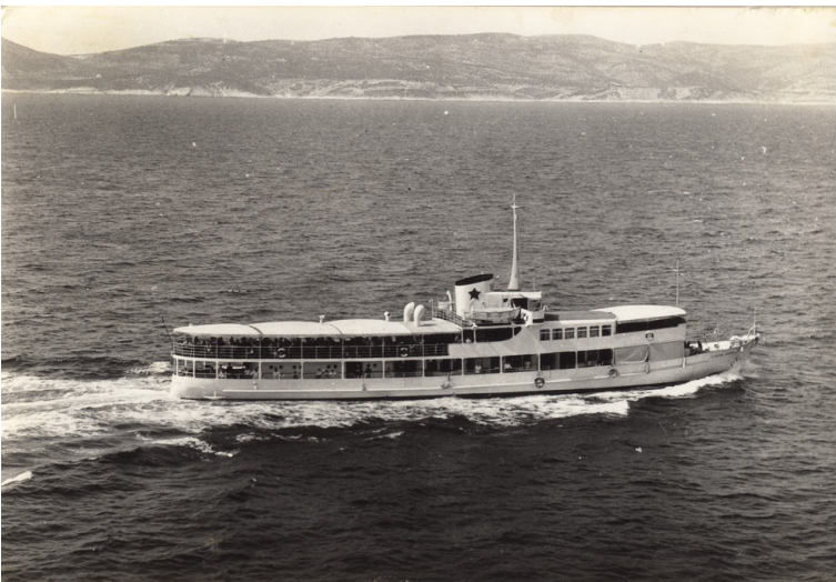
Брод „Владимир Назор“

Нажалост ове редове пишем у време, када свака помисао на прошлост и места која помињем изазивају само болне успомене. Ти простори сада су тако далеки, бојим се да ће за мене остати само живи у овим редовима. Волео бих, када бих поново за неко разумно време, када ово зло, које нас сада окружује постане само део успомена, поново посетим та тако драга места свога живота.