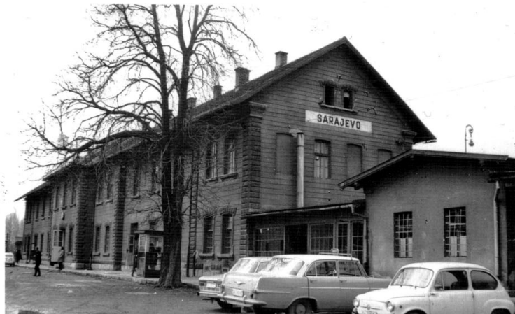
Стара железничка станица у Сарајеву

изграђена је за само седам и по месеци. При томе је пробијено девет тунела укупне дужине 2267. метара, од којих је најдужи био тунел Врандук дужине 1534 метра.