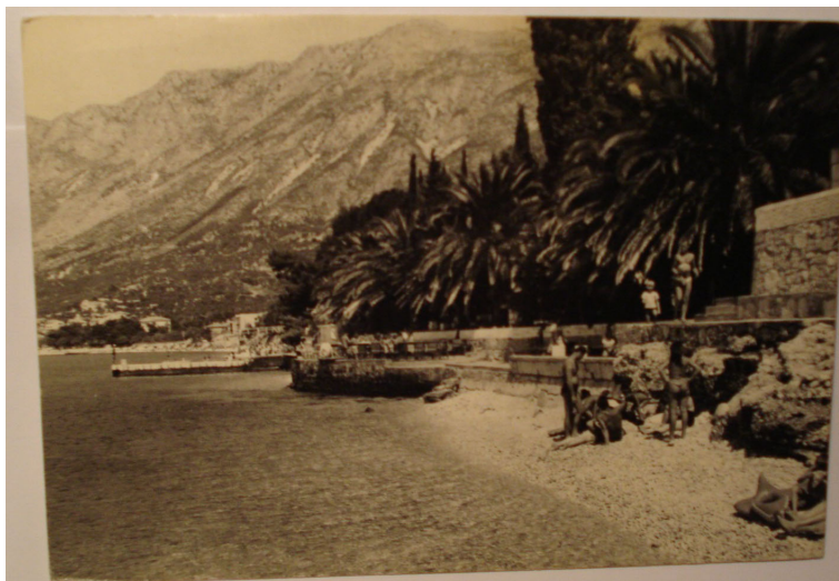
Градац из 1963. године

Не знам који је прст судбине утицао да се нађемо у кући обитељи Ујдур, тек за њу ће у великој мери бити везана моја летовања у следећих тридесетак година. Нажалост, као што свему у животу дође крај тако је и ово пријатељство некако данас постало само део сећања. Кажу да са годинама време брже пролази, а ја бих хтео да у ове редове саберем све оно што ме је везивало за те шљунковите плаже Градца, како рекох следећих скоро тридесет година. Једноставно не могу да искажем колико је туге у мени што нам се све то десило, како бих био срећан ако би и они моји негдашњи другари понекад помислили на мене, као што ја у овом тренутку, и као што сам у многим тренуцима, мислио на њих.