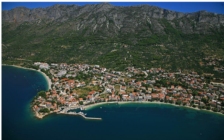
Поглед на Градац из ваздуха