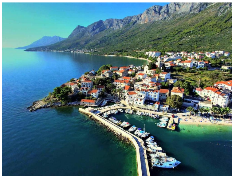
Панорама Градца – лево од цркве је кућа Ујдурових