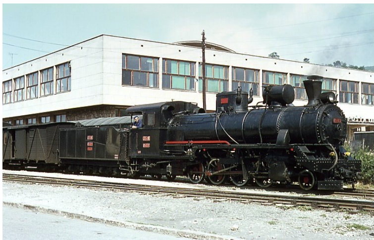
Сарајево – полазни колосек ускотрачне железнице ка мору

Сећам се да смо по доласку у Сарајево морали прво на умивање, јер је требало спрати трагове “Ћириног” угља и дима, што је улазио у вагоне сваки пут када би се закаснило са затварањем прозора у шарганским, али и другим многоборојним тунелима на траси пута између Чачка и Сарајева. Неко ће сетити и оних “Ћириних” вагона II разреда без купеа са дрвеним клупама.