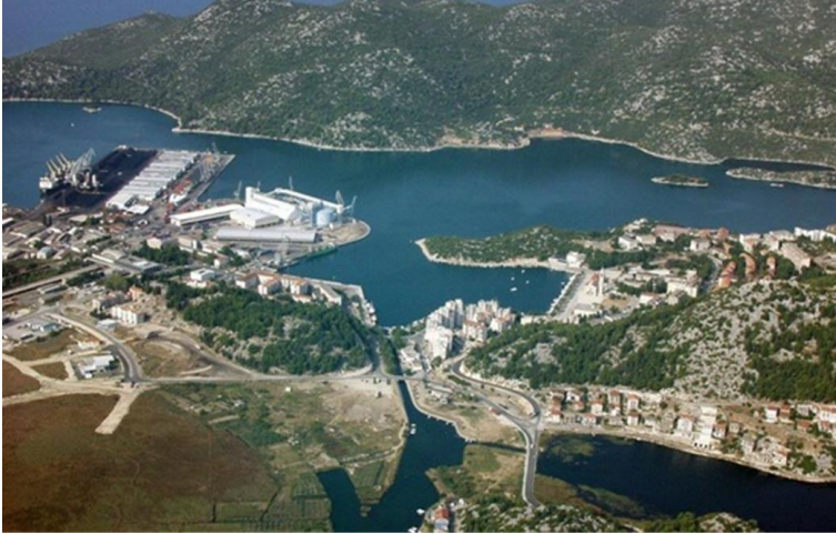
Плоче – данас

идући шинама, поред оне касарне, за коју ћу две деценије касније сазнати да се зове касарна “Маршал Тито”.