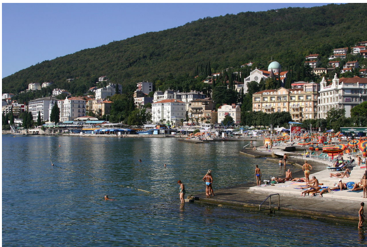
Опатија – купалиште Слатина

Ријека је до краја Првог светског рата припадала Аустро – Угарској, а од 1924. до 1947. године Италији. Ако се у обзир узме да се ради о великом лучком граду осећа се некако дах Европе.