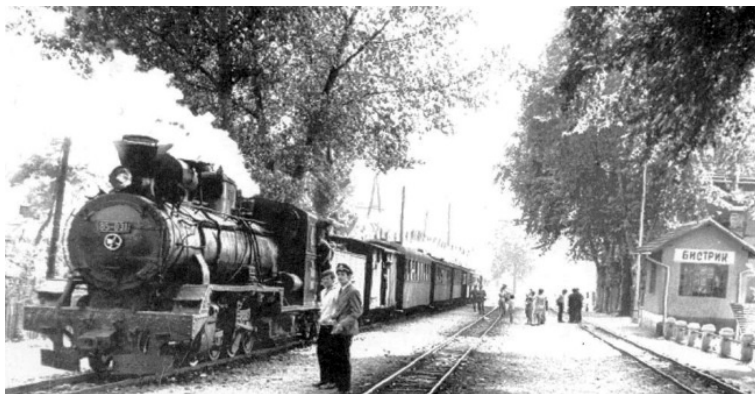
„Тура” на станици Бистрик изнад Сарајева