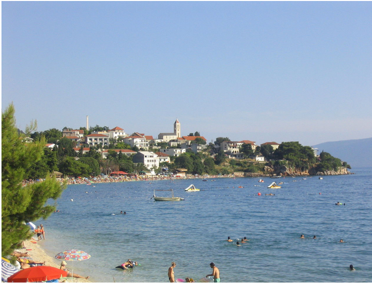
Поглед на Градац са плаже Бошац

купали. И на почетном делу плаже такође су биле огромне стене, које су бар мени некако уливале страхопоштовање.