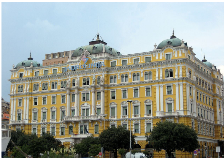
Палата „Јадран“ у Риједи

Увече смо се укрцали на брод „Партизанка“ и заплвили ка Риједи. Пут је трајао целу ноћ. Ријека је једна од највећих јадранских лука. Искрцавамо се на Риви и оно што свакој придошлицы у град прво пада у очи је палата „Јадран“ у којој је смештена управа поморског предузећа „Јадролинија“.